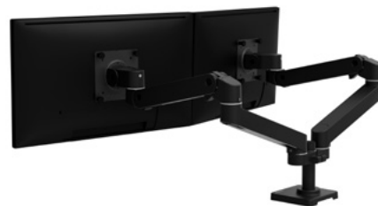
KIT DE CONVERSIÓN DE INDIVIDUAL A DOBLE LADO A LADO N.º 98-745