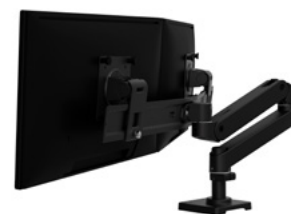
ARCO PARA MONITOR - INDIVIDUAL A DUAL DIRECTO N.º 98-737