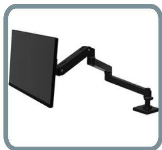
EXTENSIÓN DE BRAZO N.º 98-731