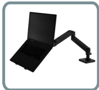
BANDEJA PARA PORTÁTIL N.º 50-193-200