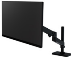
Brazo para escritorio LX Pro