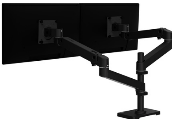
AÑADA HASTA TRES BRAZOS CON EL KIT BRAZO ADICIONAL (SOLO PARA EL MODELO DE POSTE ALTO) N.º 98-734