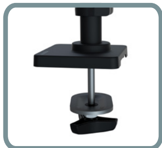
MONTURA DE OJAL N.º 98-728